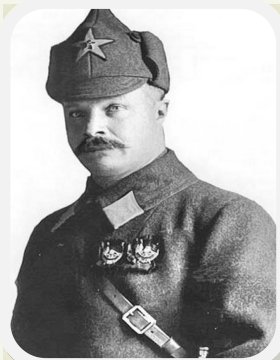
Михаил Васильевич Фрунзе

Д О С Е Р Е Д И Н Ы 1 9 2 9 Г О Д А У Л . В А Г А Н О В С К А Я